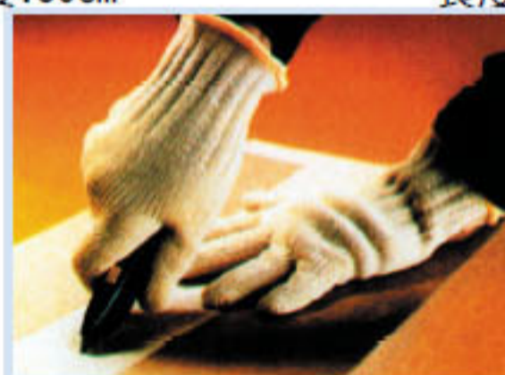
• ED-74301 耐切割手套 由3條不銹鋼絲及耐切割材料 混紡製成