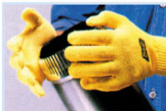
• ED-43116 防熱手套 耐熱:350°C 長度:40cm 材質:KEVLAR 特點:合手掌, 易於工作 CE認證合格