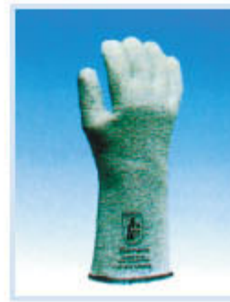
• ED-42474 非石棉防熱手套 耐熱:200°C 長度:36cm