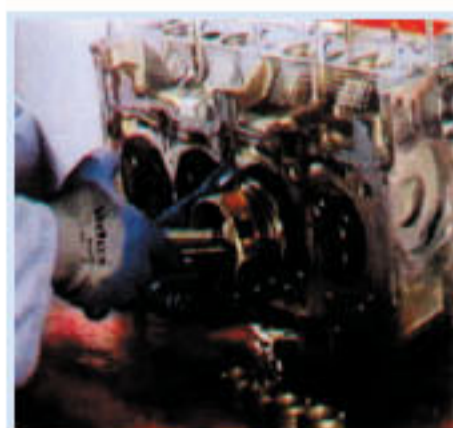
• ED-11950 耐油防滑手套 材質:尼龍材質 Nitrile塗層