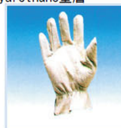
• SA-TIG6 氬焊皮手套 疲軟, 操作容易 材質:豬面皮 長度:25cm