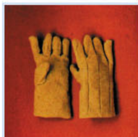
• ZETEX-PLUS 耐高溫防火手套 耐熱:1000°C 材質:ZETEX 長度:36cm