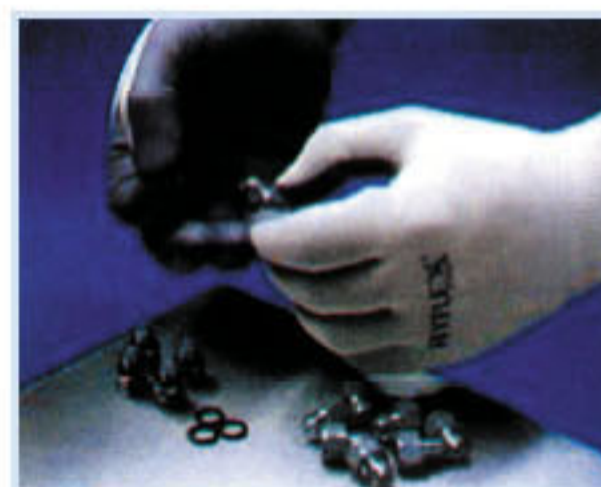
• ED-11800 耐油防滑手套 材質:尼龍材質 Nitrile塗層及 Polyurethane塗層