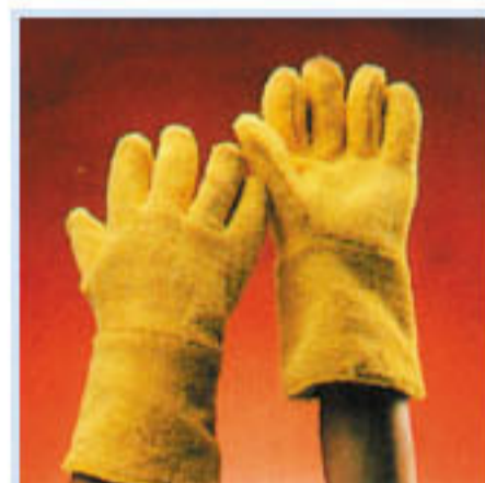
• FR-601 針織毛圈防熱手套 耐熱:400°C 材質:KEVLAR 長度:36cm