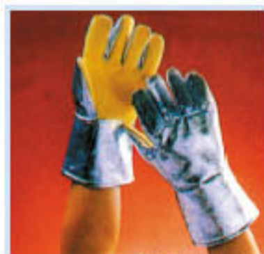
• DPKA-145 鋁箔耐熱手套 耐熱:400°C 長度:36cm 特點:五指, 可防輻射熱, 手掌以防熱布製成, 長度可訂做