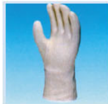
• DL-200 白色防熱手套 材質:矽膠 特點:半透明, 長約27cm可 耐熱200°C瞬間300°C , 抗溶劑、油類佳, 可防弱酸溶液