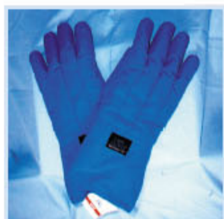
• TEMP 防寒手套 特點:防寒-125°C 長14" 材質CRYO