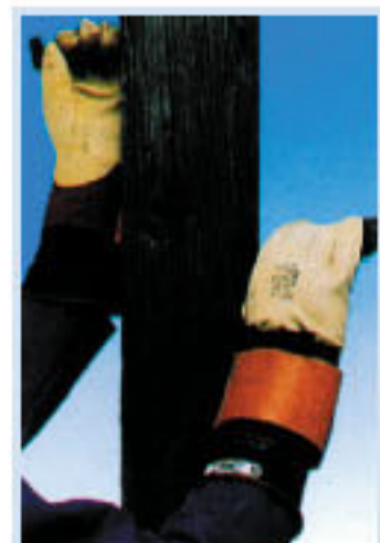
• KCL-587 耐電壓手套 耐10KV電壓, 附皮手套