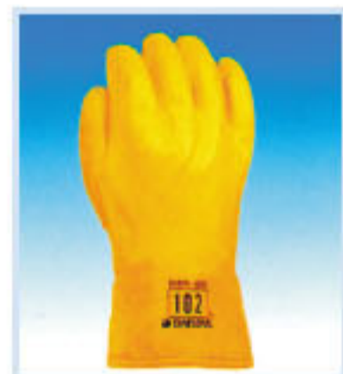
• DL-102 防寒手套 耐溫:-60°C 厚度:2mm 長度:27cm 材質:Polyurethane