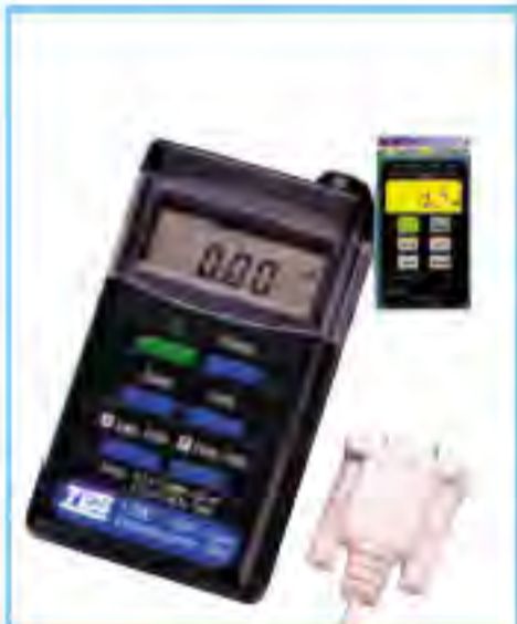
TES-1390 (EMF Tester) 電磁波測試器