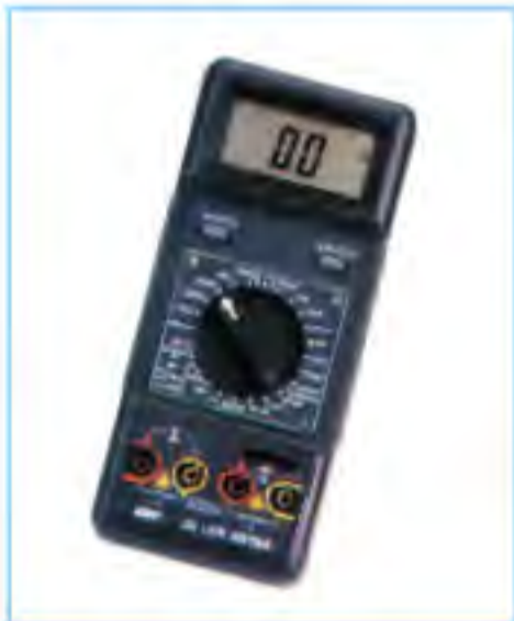
CHY-24 專業LCR電錶 價格