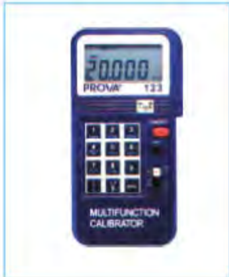
PROVA-123程控多功能校正器