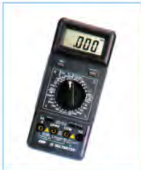
CHY-26 高解析度電錶 價格