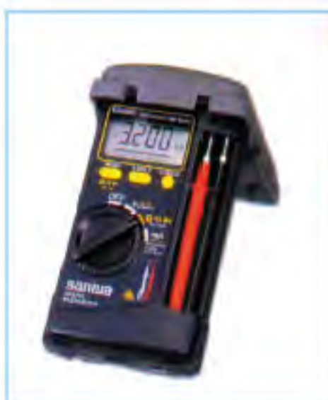
SANWA CD-800a 日製數字電錶