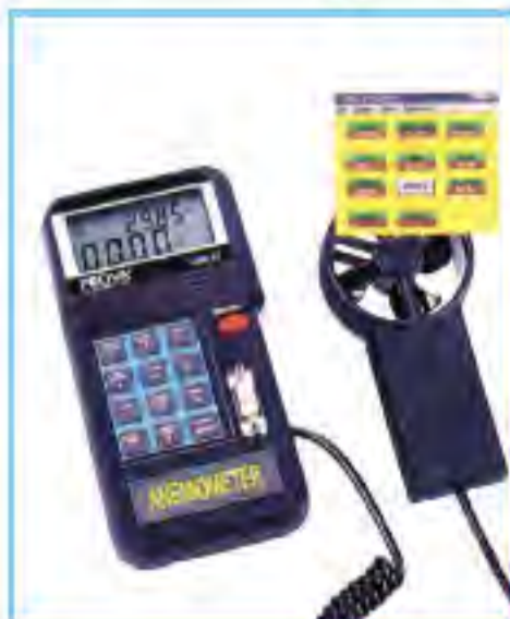
AVM-05/07 記憶式風量風速溫度計