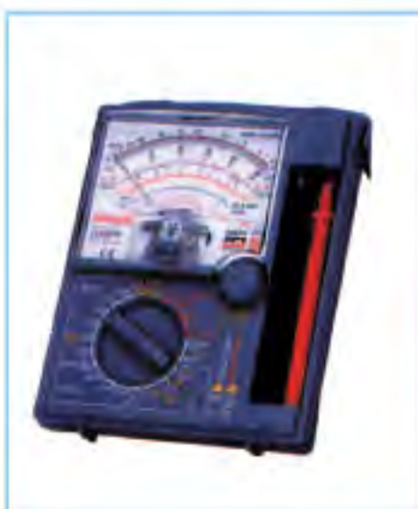
SANWA YX-360TRF 指針電錶