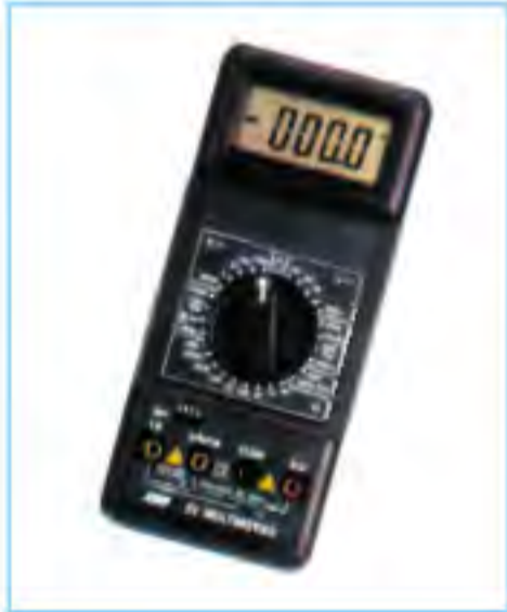
CHY-23 高精度數字電錶 價格