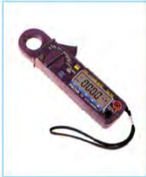
PROVA-11微電流交直流鉤錶