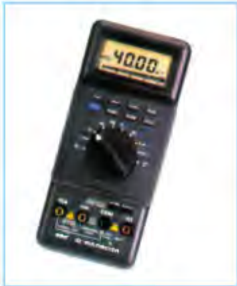
CHY-22 智慧型數字電錶 價格