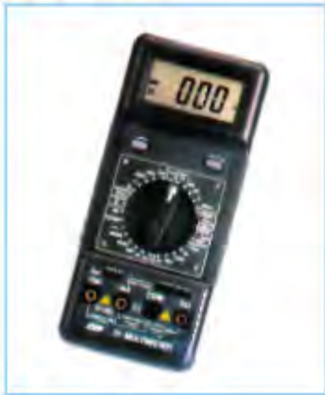
CHY-21 LCR數字電錶 價格